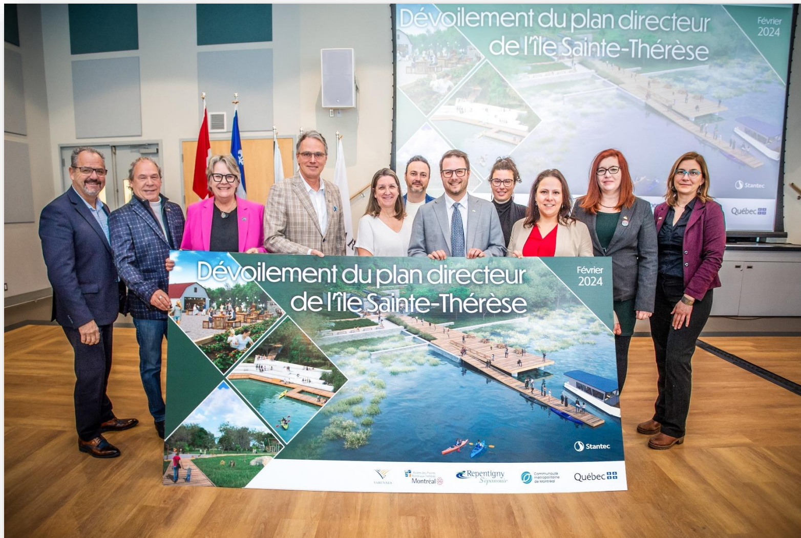
Dévoilement du plan directeur de l'île Sainte-Thérèse